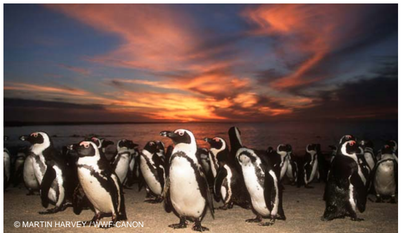
濒临灭绝的黑脚企鹅，南非。